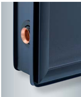
Kollektorrahmen mit speziellem Indachprofil zur Aufnahme des Eindeckrahmens

Beide Kollektoren sind besonders montagefreundlich. Integrierte Vor- und Rücklaufrohre ermöglichen eine sichere Montage auch größerer Kollektorfelder mittels flexibler Edelstahl-Wellrohr-Steckverbinder. Bis zu zwölf Sonnenkollektoren können einfach miteinander verbunden werden. Die Flachkollektoren sind universell zur Aufdachmontage, für die Dachintegration und die aufgeständerte Montage, zum Beispiel auf Flachdächern, geeignet. Das montagefreundliche Viessmann Befestigungssystem besteht aus statisch geprüften und korrosionssicheren Bauteilen aus Edelstahl und Aluminium.