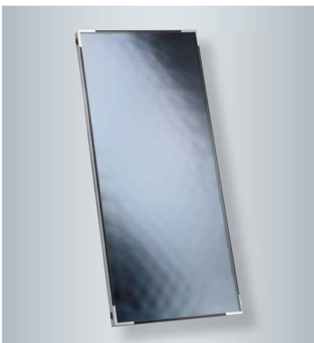
Flachkollektor Vitosol 100-FM